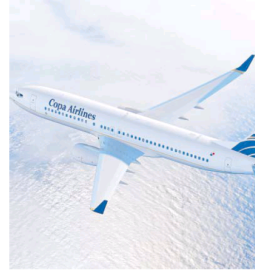
Copa es dueña o arrendataria de cien aviones.

Los cuidados que la aerolínea es capaz de conferir a sus naves van desde el cambio de motores y baterías, la restauración de los asientos